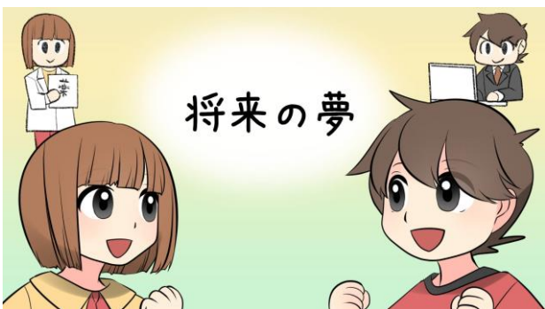
4. 夢をかなえるにはお金も必要なことを具体例で説明