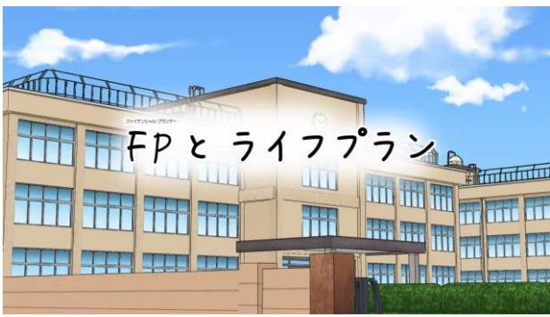
1. FPが小学校で授業をするシチュエーション