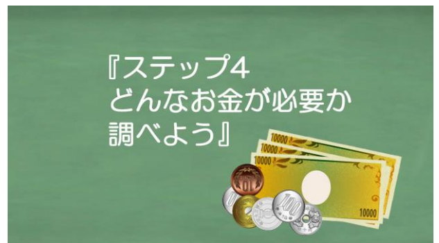
9. ステップ4:夢をかなえるまでに必要なお金を調べる