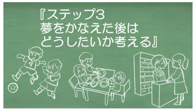
8. ステップ3:夢をかなえた後の自分を想像する