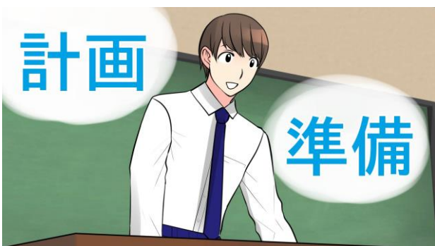
5. 夢をかなえるには計画を立て、準備することが大切