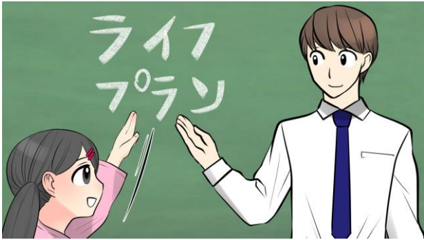
2. ライフプランについての説明