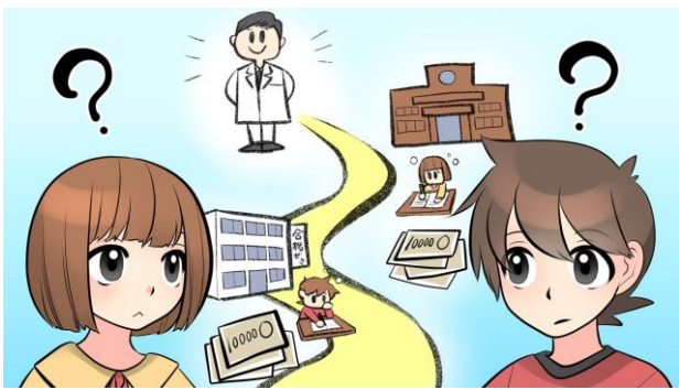
3. ライフプランニングとは目標のために計画をたてること